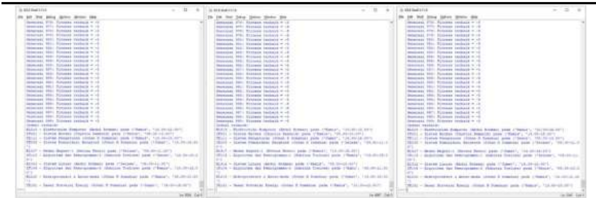
Gambar 9. Hasil simulasi Kasus-2: a) iterasi-1 ; b) iterasi-2 ; c) iterasi-3

Hasil simulasi Kasus-2 menunjukkan terdeteksi conflict yakni: pada iterasi-1 menunjukkan ‘EL213-Elektronika Komputer’ dan ‘EL218-Mikroprosesor & Antar-muka’ dosen ‘Abdul Rohman’ dan ‘Johan H Somahua’ pada ‘Kamis, 10.00-12.00’ di kelas yang sama ‘2TE02’. Lalu dilakukan iterasi ke-2, namun masih terdeteksi conflict yakni: pada iterasi-2 menunjukkan ‘TE208-Sistem Komunikasi Bergerak’ dan ‘TE131-Dasar Konversi Energi’ dosen ‘Johan H Somahua’ pada hari dan jam/waktu yang sama ‘Jumat, 14.00-16.00’ di kelas ‘2TE01’ dan ‘1TE01’. Lalu dilakukan iterasi ke-3 dan diperoleh jadwal yang optimal ditunjukkan pada Gambar 10.