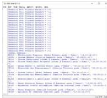
Gambar 13. Hasil simulasi Kasus-4 cukup satu kali iterasi

Hasil simulasi Kasus-4 menunjukkan tidak terdeteksi conflict , langsung diperoleh jadwal yang optimal seperti ditunjukkan pada Gambar 14.