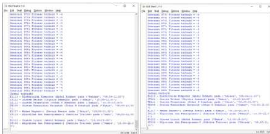
Gambar 7. Hasil simulasi Kasus-1: a) iterasi-1 ; b) iterasi-2

Pada penelitian ini digunakan bahasa pemrograman Python untuk mensimulasikan Algoritma Genetika yang dibangun. Interpreter yang digunakan adalah IDLE Python 3.11 64-bit untuk men- generate kode sintaks yang dituliskan. Masing-masing sample kasus yang telah disusun; yakni skenario kasus-1 sampai dengan 4 dituliskan dalam bahasa pemrograman Python, lalu di- generate dengan interpreter yang telah disiapkan. Target yang diinginkan bahwa apabila terjadi conflict , maka iterasi akan dilakukan kembali sampai ditemukan hasil no-conflict . Jumlah n -iterasi menunjukkan rate optimalisasi jadwal yang dihasilkan.