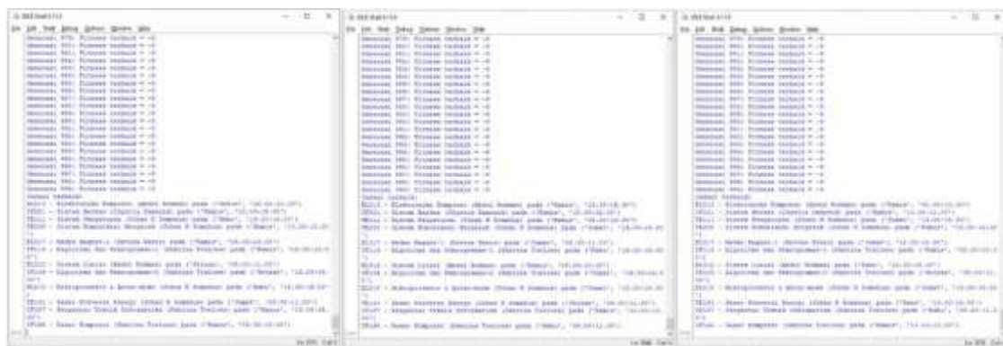
Gambar 11. Hasil simulasi Kasus-3: a) iterasi-1 ; b) iterasi-2 ; c) iterasi-3

Hasil simulasi Kasus-3 menunjukkan terdeteksi conflict yakni: pada iterasi-1 menunjukkan ‘TE111-Sistem Pengaturan’ dan ‘EL218-Mikroprosesor & Antar-muka’ dosen yang sama ‘Johan H Somahua’ pada ‘Jumat, 13.00-15.00’ di kelas ‘1TE01’ dan ‘2TE02’. Lalu dilakukan iterasi ke-2, namun masih terdeteksi conflict yakni: pada iterasi-2 menunjukkan ‘TE111-Sistem Pengaturan’ dan ‘EL218-Mikroprosesor & Antar-muka’ dosen ‘Johan H Somahua’ pada hari dan jam/waktu yang sama ‘Rabu, 14.00-16.00’ di kelas ‘1TE01’ dan ‘2TE02’. Lalu dilakukan iterasi ke-3 dan diperoleh jadwal yang optimal ditunjukkan pada Gambar 12.